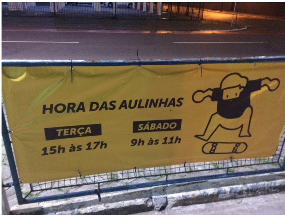
Imagem 1: Banner informativo dos horário de aula