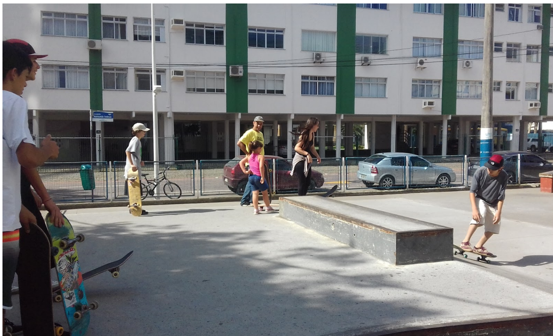
Imagem 3: Alunos praticando aula.