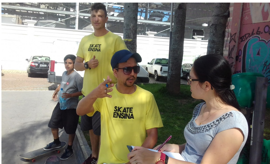
Imagem 2: Visita.