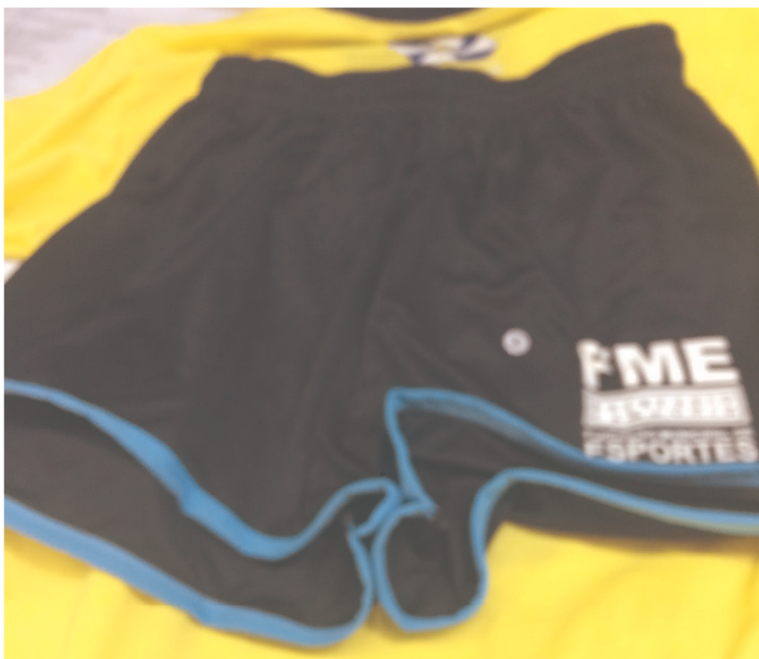
Imagem 13: Shorts uniforme equipe feminina.