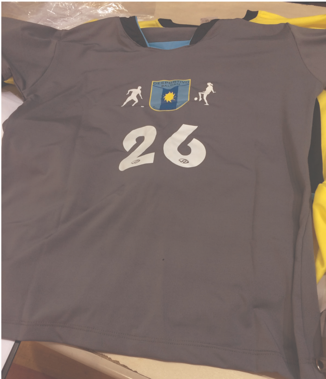
Imagem 14: Uniforme para treino e/ou competição das equipes.