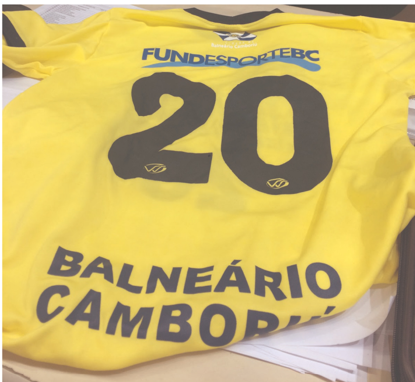
Imagem 12: Camisa uniforme Goleiro (a).