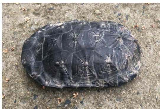
cágado cabeça de cobra