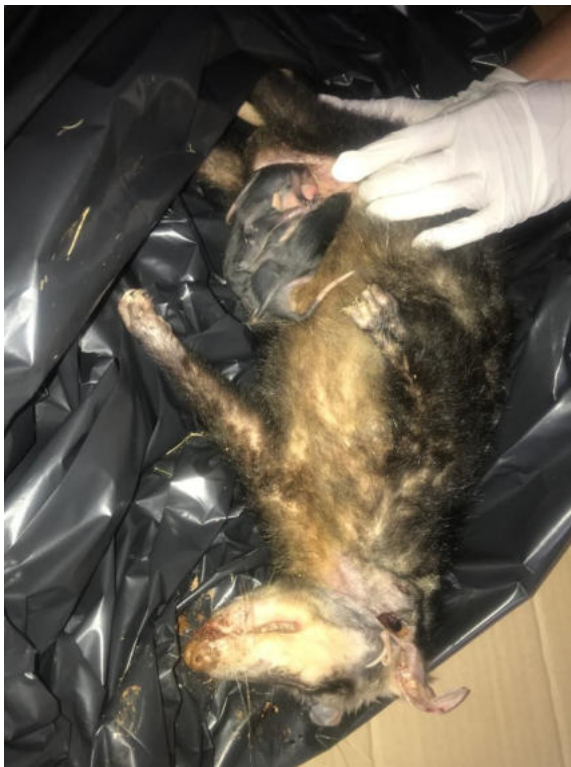
gambá com filhotes