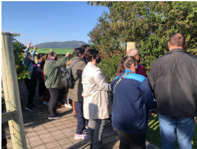
Casa da Mulher e Voluntário