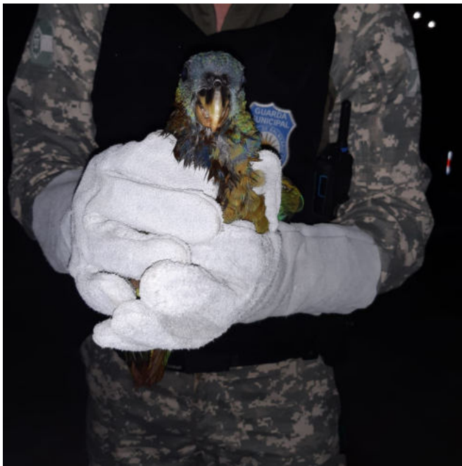
papagaio cara suja