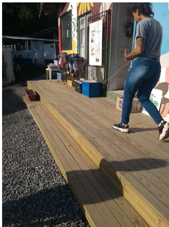
Área com Deck recém feito.