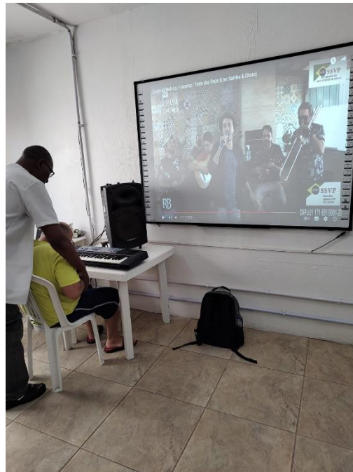
AULA DE MUSICALIZAÇÃO