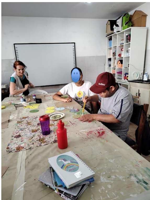
AULA DE ARTE