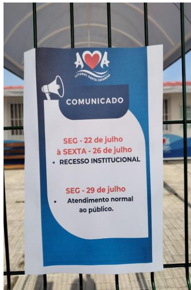
FOTO DO PORTÃO INDICANDO RECESSO.