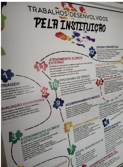
PLANILHA DA VISITA