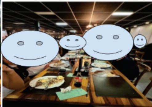
Contratenação e entrega dos certificados