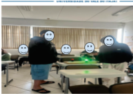
Quiz aula de Comunicação e Linguagem