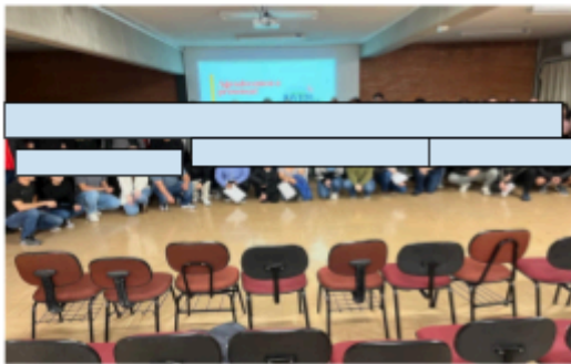
Reunião Jovem Aprendiz