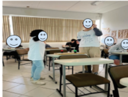
Quiz aula de Comunicação e Linguagem