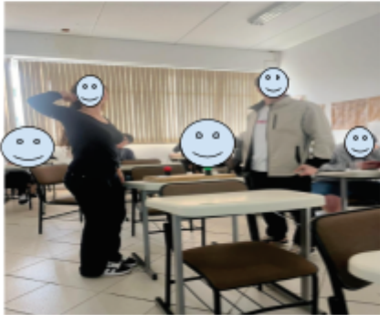
Quiz aula de Comunicação e Linguagem