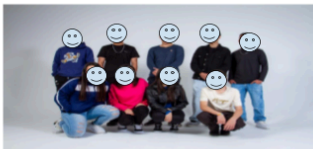
Integração- turma manhã