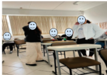
Quiz aula de Comunicação e Linguagem