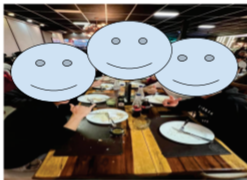
Contratenação e entrega dos certificados