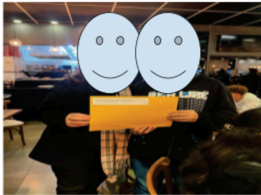
Confraternização e entrega dos certificados