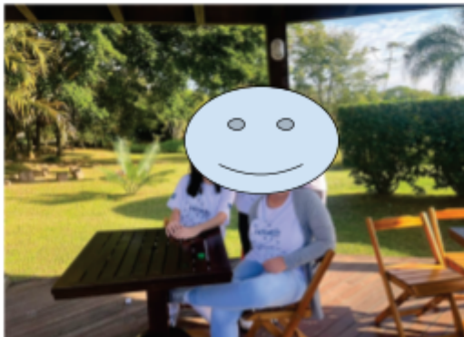
Momento do intervalo - lanche