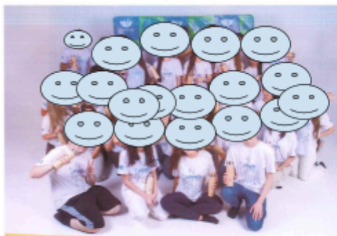
Turma pré-qualificação com as garrafas que receberam