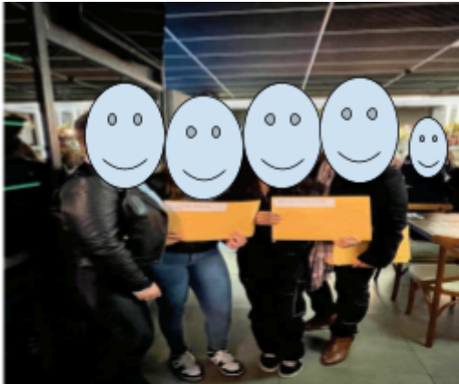
Confraternização e entrega dos certificados