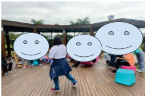
Dinâmica ao ar livre da aula de Comunicação e Linguagem