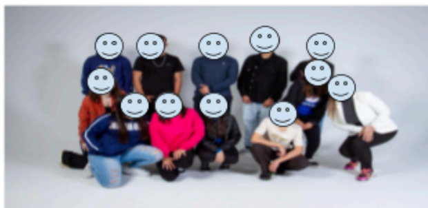
Integração- turma manhã