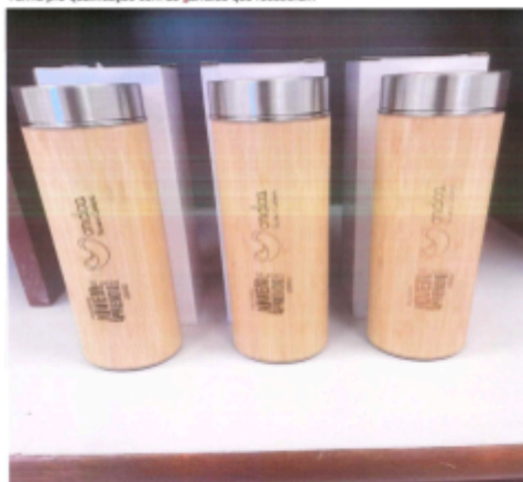
Garrafa que cada jovem recebeu