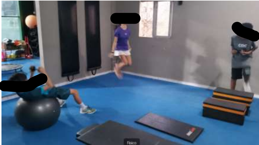
Atividades em dias de chuva.