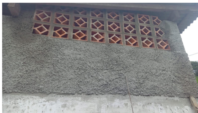
Imagem: Casarão / Barracão