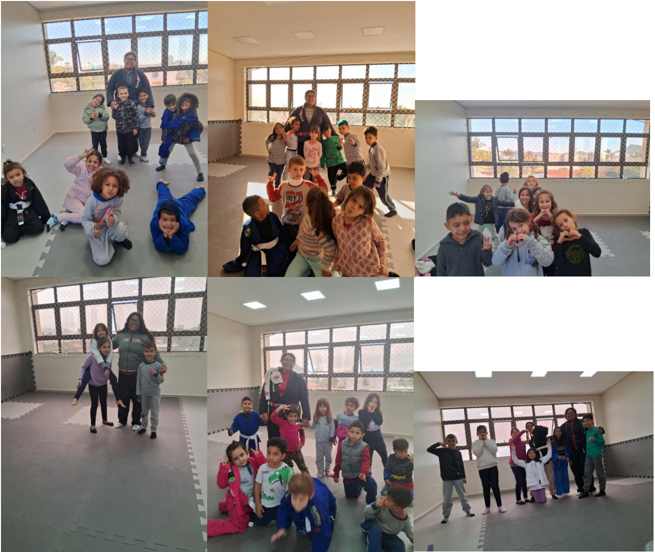
Balneário Camboriú, 19 de agosto de 2024.