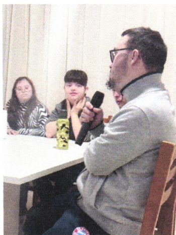
30/07 - Oficina com os jovens e adultos

Balneário Camboriú, 09 de agosto de 2024.