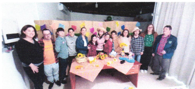
16/07 devolutiva com os jovens e adultos