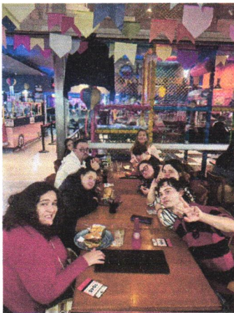
27/07 - jovens em conexão