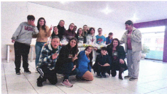
02/07 Oficina com os jovens e adultos no CRAS